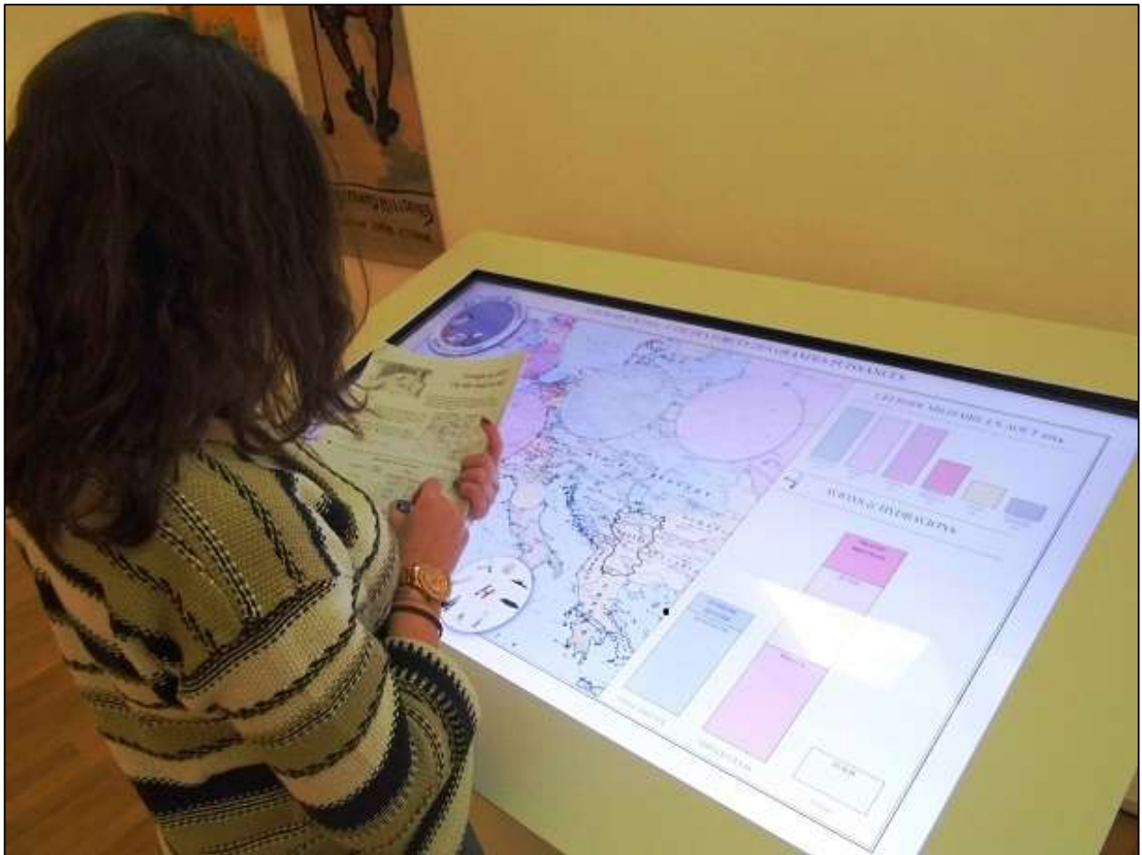
Εικόνα 18: Ψηφιακός διαδραστικός χάρτης.

αποκλείουν κάποιους επισκέπτες μεγαλύτερης ηλικίας λόγω μη εξοικείωσης στη χρήση των νέων τεχνολογιών.