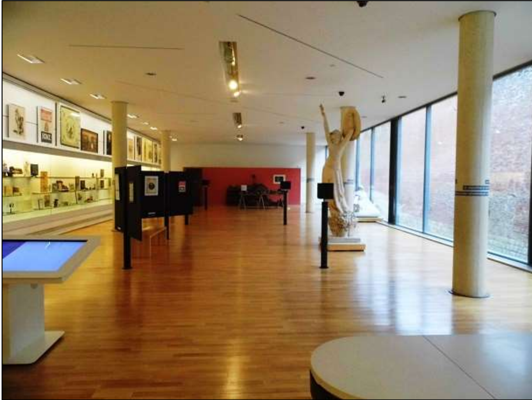
Εικόνα 8: Μετά τον πόλεμο: Πόνος και αναμνήσεις. (Πέμπτη αίθουσα)

Το Historial διαφοροποιείται από τα περισσότερα πολεμικά μουσεία της Ευρώπης τα οποία αναφέρονται και στον Α΄ Παγκόσμιο Πόλεμο, όπως το Πολεμικό Μουσείο της Αθήνας, 9 το HeeresGeschichtliches Museum της Βιέννης στην Αυστρία, 10 το Imperial War Museum του Λονδίνου στη Βρετανία, 11 το Musée de l' Armée του Παρισιού στην Γαλλία, 12 και το Historijski Muzej του Σαράγεβο στην Βοσνία-Ερζεγοβίνη, 13 τα οποία επισκεφθήκαμε και διαπιστώσαμε ότι χαρακτηρίζονται κυρίως από μία μονοδιάστατη παραδοσιακή, εθνοκεντρική, γεγονοτολογική και μιλιταριστική ιστορία του πολέμου, χρησιμοποιώντας θετικιστικές αφηγήσεις της Ιστορίας. Το Historial προσφέρει μια σύγχρονη αναπαράσταση του Α΄ Παγκοσμίου Πολέμου, χρησιμοποιώντας ως βάση της έκθεσης έναν συγκριτικό άξονα τριών επιπέδων που απλώνεται περιμετρικά σε όλες τις αίθουσες, ο οποίος παρουσιάζει, σε παράλληλη διάταξη, υλικά κατάλοιπα της εποχής που αφορούν την πολιτισμική και κοινωνική ζωή κυρίως του άμαχου πληθυσμού από τη Γερμανία, τη Γαλλία και τη Βρετανία (βλ. Εικόνα 9). Αντανακλώντας τις στάσεις και τις νοοτροπίες των διαφόρων εμπόλεμων μερών, η παρουσίαση επιτρέπει μια συγκριτική ανάγνωση των αντικειμένων της καθημερινής ζωής, που είναι διαποτισμένα από την καθημερινή ζωή, την πατριωτική πίστη αλλά και τον μιλιταρισμό, και με την πανταχού παρουσία του θανάτου στο στρατιωτικό μέτωπο.