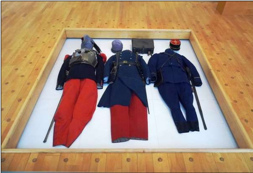
Εικόνα 10: Οριζόντια αναπαράσταση του πολέμου με την παρουσίαση στολών και όπλων ανώνυμων στρατιωτών

Στους τοίχους αλλά και στο δάπεδο είναι τοποθετημένες σύντομες επεξηγηματικές λεζάντες. Επίσης, σε όλες τις εκθεσιακές ενότητες και υποενότητες υπάρχουν περίπου 60 οθόνες που προβάλλουν βίντεο κινηματογραφικών επικαιρών, τα οποία συνδέουν τον οριζόντιο άξονα των πολεμικών μουσειακών εκθεμάτων με τον περιμετρικό συγκριτικό άξονα των πολιτισμικών πλαισίων. Παράλληλα, στην είσοδο κάθε αίθουσας, τίθεται το ιστορικό και γεωγραφικό πλαίσιο του πολέμου με συμβατικούς και ψηφιακούς χάρτες σε διαδραστικές οθόνες αφής.