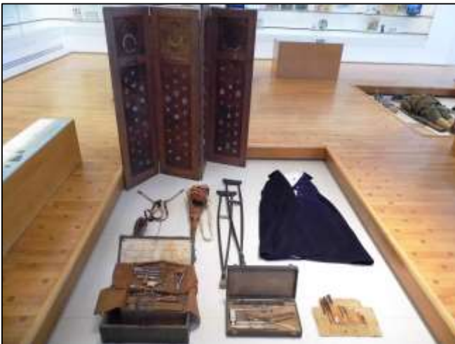
Εικόνα 14: Αντιμετώπιση τραυμάτων.