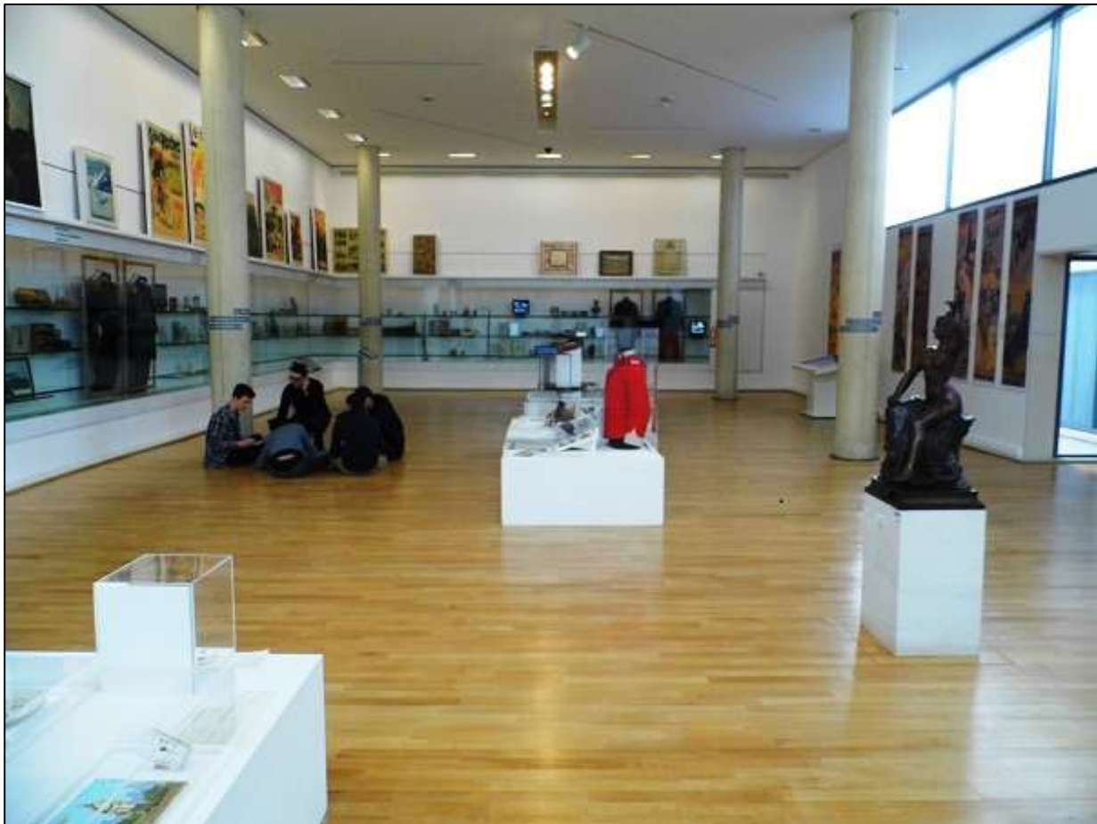
Εικόνα 3. Πριν από τον πόλεμο: 1914 . (Πρώτη αίθουσα)

Ακολουθεί τη γραμμική χρονολογική αφήγηση από την αρχή έως το τέλος του πολέμου. Είναι χωρισμένη σε πέντε αίθουσες και σε μία αίθουσα προβολής: (α) Πριν από τον πόλεμο: 1914 , (β) Εισχωρώντας στον πόλεμο: 1914-1916 , (γ) Αίθουσα προβολής: Η Μάχη του Σομ του Laurent Véray , (δ) Προς τον Ολοκληρωτικό Πόλεμο: 1916-1918 , (ε) Πόλεμος: Αίθουσα φωτογραφικών πορτρέτων και χαρακτηριστικών έργων του Otto Dix , (στ) Μετά τον Πόλεμο: Πόνος και αναμνήσεις (βλ. Εικόνες 3-8).