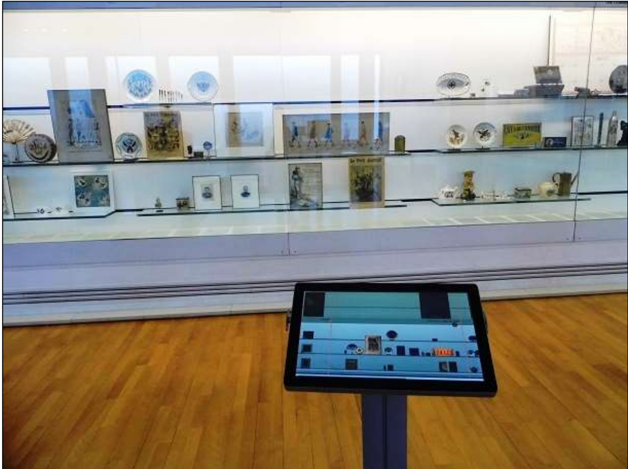
Εικόνα 19: Διαδραστική ψηφιακή οθόνη αφής.

επιλέξει να παρατηρήσει όλα τα αντικείμενα μίας ενότητας, κινούμενος ταυτόχρονα και στον χρονολογικό άξονα στο κάτω μέρος της οθόνης. Επιλέγοντας να πατήσει πάνω σε ένα εικονιζόμενο αντικείμενο, αυτό μεγεθύνεται και η οθόνη του παρέχει τον τίτλο και μερικές συνοπτικές πληροφορίες για αυτό.