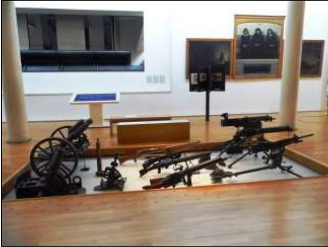
Εικόνα 12: Μηχανές του πολέμου.

έτσι ώστε ο επισκέπτης να ακολουθεί αυτήν την πορεία ανάγνωσης της μάχης και του πολέμου, η οποία οδηγεί στη διαπίστωση της ανθρώπινης αποσύνθεσης και καταστροφής με αναφορά σε ένα αναρίθμητο και ανώνυμο πλήθος τραυματισμένων στρατιωτών (Winter 2006).