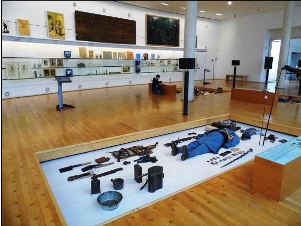
Εικόνα 4. Εισχωρώντας στον πόλεμο: 1914-1916. (Δεύτερη αίθουσα)