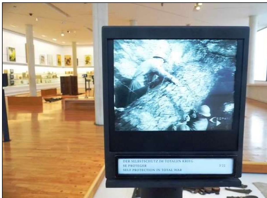
Εικόνα 17: Οθόνη προβολής κινηματογραφικών επικαίρων του Α΄ Παγκοσμίου Πολέμου.

Οι υπεύθυνοι του σχεδιασμού και της υλοποίησης της μόνιμης έκθεσης του Historial, παράλληλα με τους πρωτοποριακούς τρόπους παρουσίασης των αντικειμένων του πολέμου και τη τριεθνή προσέγγιση της κοινωνικής και πολιτισμικής ιστορίας, έχουν εντάξει διακριτικά, αλλά ως κύριο μέρος της έκθεσης, την αναπαράσταση του πολέμου και με την προβολή σχετικών κινηματογραφικών επικαίρων.