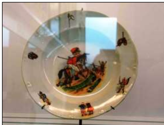
Εικόνα 11: Παιδικό πιάτο με μιλιταριστική διακόσμηση.

Η έκθεση των μουσειακών αντικειμένων συνοδεύεται με σύντομες λεζάντες στις τρεις αντίστοιχες γλώσσες. Στις γυάλινες προθήκες εκτίθενται αφίσες, πιάτα, είδη οικιακής χρήσης, καθώς και πλήθος άλλων μικροαντικειμένων που περιλαμβάνουν ακόμα και παιδικά παιχνίδια με μιλιταριστικό και πατριωτικό περιεχόμενο.