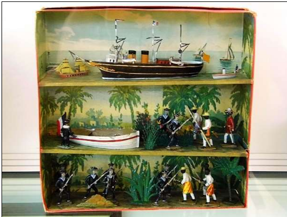
Εικόνα 20: Γαλλικό παιχνίδι με μιλιταριστικό και αποικιοκρατικό περιεχόμενο.

Επίσης, αφιερώνει μια ολόκληρη αίθουσα (βλ. Εικόνα 3, παραπάνω), την πρώτη αίθουσα - Ο Κόσμος πριν από τον πόλεμο: 1914 - για να παρουσιάσει το σύστημα της αποικιοκρατίας των μεγάλων ευρωπαϊκών δυνάμεων κατά τον 19 ο αιώνα, καθώς και τη ζωή των ανθρώπων στις αποικίες σε συσχέτιση με την αποικιοκρατική οπτική των Δυτικών που θεωρούσαν τους γηγενείς πληθυσμούς απολίτιστους και τους παρομοίαζαν με ζώα. Με άλλα λόγια, περιγράφεται η κραταιά θέση της Ευρώπης στον κόσμο πριν από το 1914, όταν ο αυξανόμενος αποικιοκρατικός ιμπεριαλιστικός ανταγωνισμός των μεγάλων δυνάμεων για την παγκόσμια κυριαρχία οδήγησε στον Α΄ Παγκόσμιο Πόλεμο.