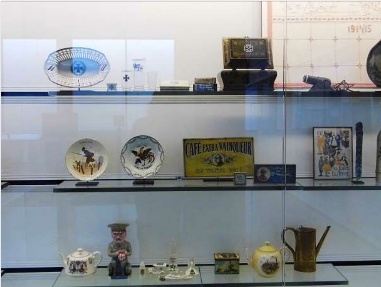
Εικόνα 9: Παράλληλη έκθεση αντικειμένων από την κοινωνική και πολιτισμική ιστορία της Γερμανίας, της Γαλλίας και της Βρετανίας.

Πρωτοποριακός είναι ο σχεδιασμός της έκθεση με την τοποθέτηση μουσειακών αντικειμένων αλλά και σχετικών έργων τέχνης ελεύθερων στον χώρο των αιθουσών. Επίσης, πρωτοποριακή μπορεί να χαρακτηριστεί και η επιλογή της αναπαράστασης των χαρακωμάτων και του μετώπου σε σημεία του ξύλινου δαπέδου. Οι εμπειρίες των στρατιωτών αναπαρίστανται με την έκθεση των στολών, των όπλων και των προσωπικών αντικειμένων τους. Σε αντίθεση με τις συνήθειες μουσειολογικές πρακτικές τις οποίες συναντάμε και στα περισσότερα πολεμικά μουσεία ακόμα και σήμερα όπου οι κούκλες που αναπαριστούν του στρατιώτες βρίσκονται τοποθετημένες μέσα σε βιτρίνες σε όρθια στάση ντυμένες με τις στρατιωτικές στολές και φέρουν τα όπλα τους, στο Historial οι στολές και τα όπλα των στρατιωτών είναι τοποθετημένες σε οριζόντια στάση μέσα σε εσοχές ή λάκκους από λευκό μάρμαρο ενσωματωμένο στο ξύλινο δάπεδο, που συμβολίζουν τα χαρακώματα, τα οποία διέσχιζαν όλη την έκταση του ποταμού Σομ (περίπου 40 χλμ.) αλλά και την κοινή δυστυχία των στρατιωτών. Οι μαρμάρινες εσοχές μοιάζουν με λάκκους ταφών ή αρχαιολογικών ανασκαφών.