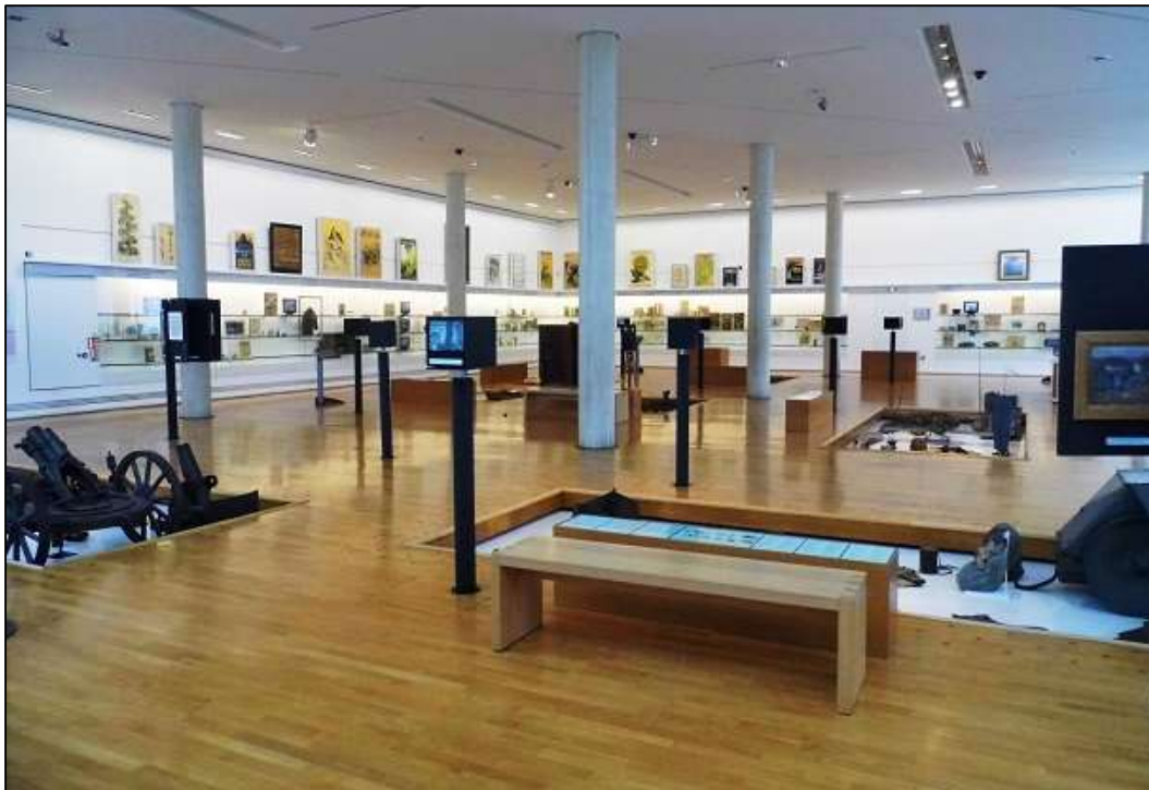
Εικόνα 6. Προς τον ολοκληρωτικό πόλεμο: 1916-1918. (Τρίτη αίθουσα).