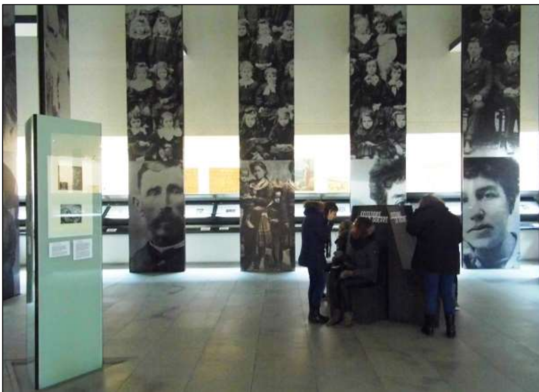
Εικόνα 7. Πόλεμος: Φωτογραφικά πορτρέτα και χαρακτηριστικά έργα του Otto Dix. (Τέταρτη, κεντρική αίθουσα) Τα έργα του Dix παρουσιάζονται στην οριζόντια περιμετρική προθήκη, ενώ μπροστά τους υπάρχουν στήλες με φωτογραφικά πορτρέτα ανθρώπων από την προπολεμική περίοδο.