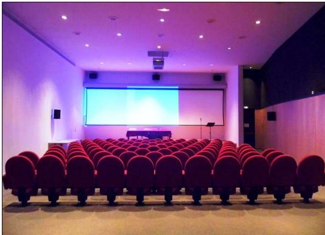
Εικόνα 5. Η αίθουσα προβολής της ταινίας «Η Μάχη του Σομ» του Laurent Véray.