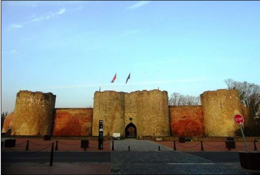
Εικόνα 1. Η είσοδος στο Μουσείο Historial de la Grande Guerre από το μεσαιωνικό κάστρο.