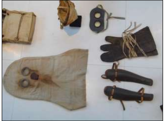
Εικόνα 13: Μέσα Αυτοπροστασίας.