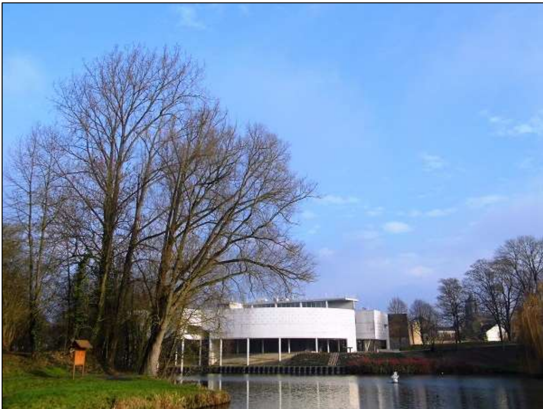
Εικόνα 2. Το κτίριο του Μουσείου Historial de la Grande Guerre κοντά στον ποταμό Σομ.