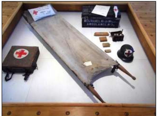
Εικόνα 15: Ιατρική φροντίδα.

Η Μάχη του Σομ, ειδικά η τραυματική εμπειρία που βίωσαν οι στρατιώτες, αναπαριστάται κυρίως μεταφορικά ως απύουσα, καθώς πουθενά μέσα στην αίθουσα δεν παρουσιάζεται ή απεικονίζεται ρεαλιστικά ο τρόμος, ο πόνος και η απώλεια που προκάλεσε στα εκατομμύρια των στρατιωτών που συμμετείχαν σε αυτή. Σύμφωνα με τους υπεύθυνους του Μουσείου, η τραυματική εμπειρία του πολέμου, όπως υπήρξε στην πραγματικότητα, «είναι αδύνατο να προσεγγιστεί και να αναπαρασταθεί με οποιοδήποτε τρόπο ή μέσο» (Winter 2008: 35). Η απουσία, η ανωνυμία, το κενό και η